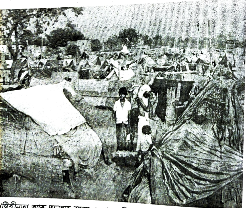
প্ৰতিহীনতা আৰু অনুন্নত স্বাস্থ্য সেৱাৰ সুবিধায়ে ব্ৰিটিছ শাসিত বৰ্ষত জনসংখ্যাৰ লেহেমীয়া বৃদ্ধি ঘটাইছিল।

বৃত্তিগত গাঁথনি, অৰ্থাৎ ঔপনিৱেশিক সময়ত ভাৰতবৰ্ষত বিভিন্ন উদ্যোগ তথা খণ্ডৰ মাজত কৰ্মৰত লোকৰ বিতৰণত পৰিৱৰ্তনৰ কোনো চিন নাছিল।